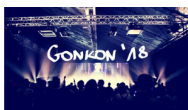
WIDEORELACJA Z GONKONU